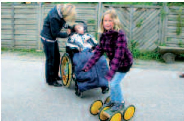
Ein Herz haben und hilfsbereit sein ist immer gut.