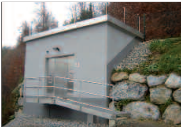
Neuer Wasserhochbehälter in Friesach.

Mit Abschluss dieses Projektes ist nun die Versorgungssicherheit in Friesach deutlich verbessert.