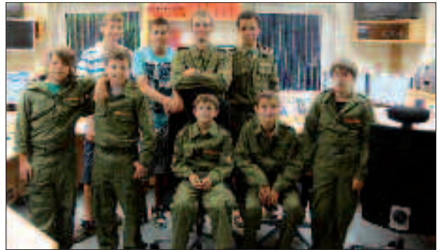
Die Peggauer Jung-Florianis.