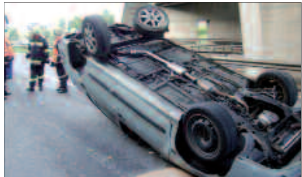
Einer der vielen Feuerwehreinsätze auf unseren Straßen.