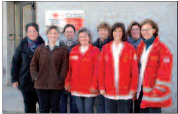
Das Team des Hauskrankenpflege-Stützpunktes Peggau

Tel. 0 31 27/22 70, Mobil 0676/87 54 40 131