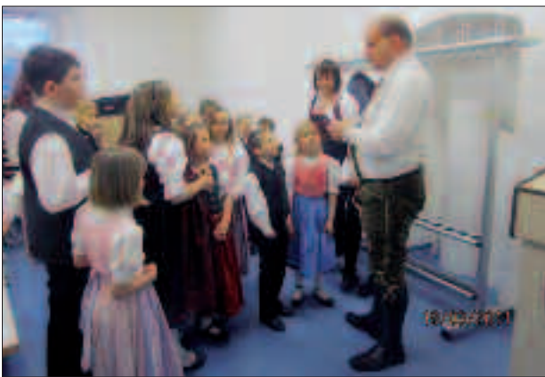
Die Kindertanzgruppe bereitet ihren Auftritt vor.