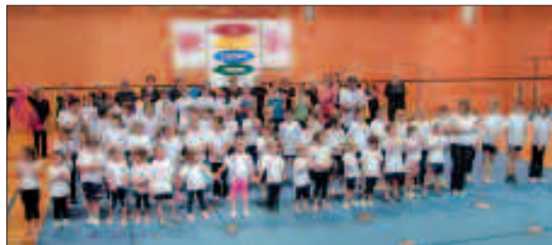
Die traditionelle Sonnwendfeier des Turnvereines.

Nutzen Sie oder Ihre Kinder unser vielfältiges Angebot. Schnuppern Sie unverbindlich einmal in eine Stunde, Sie alle sind herzlich willkommen.