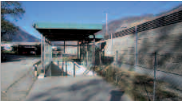
ÖBB-Lärmschutzwand in der Bodenfeldsiedlung.

Der Bau der von der Gemeinde schon so lang geforderten ÖBB-Lärmschutzwand ist heuer, gekoppelt an den Zeitplan des Bahnhofumbaus, endlich erfolgt. Sehr erfreuliches „Detail am Rande“ war auch, dass seitens der Gemeinde nach langwierigen Verhandlungen und komplizierten Neuberechnungen auch der Bau der sogenannten „Lärmschutzwand 2“ entlang der Bodenfeldsiedlung durchgesetzt werden konnte. Mittels Sondervertrag und Zusatzfinanzierung seitens der Marktgemeinde Peggau in Höhe von ca. 70.000,- konnte auch dieser für die Anrainer so wichtige Bau ausverhandelt werden.