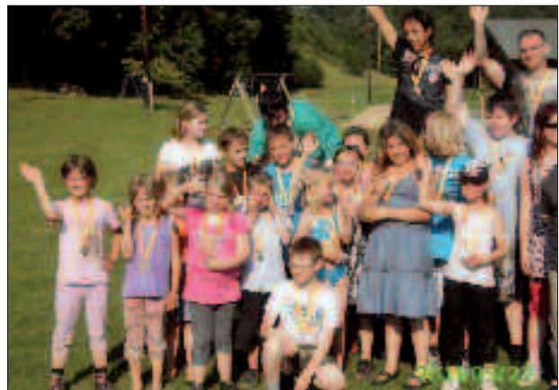
Tag voller Spiel und Spaß für die Kindertanzgruppe

◆ Die Kindertanzgruppe wurde heuer mit einem ganz besonderen Geschenk belohnt: Am 22. Mai 2011 fand ein Ausflug mit den Eltern und interessierten Mitgliedern in das Spiel- und Abenteuerland Welten im Burgenland statt. Es wurde ein Tag voller Spiel und Spaß!