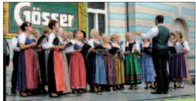
Auf der Bühne beim „Aufsteirern“ am Grazer Tummelplatz.