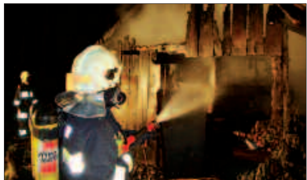
Löscheinsatz mit dem Atemschutzgerät.