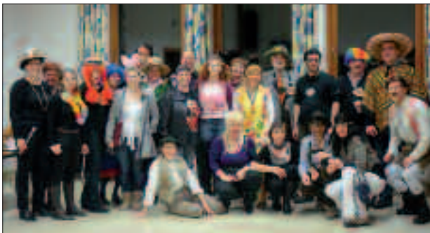
Der Fasching wurde originell gefeiert.

Im März feierten wir ausgiebig Fasching. Der Traktorfaschingsumzug in Deutschfeistritz bot sich uns nahezu perfekt, um neue Sängerinnen und Sänger zu suchen und so funktionierten wir einen gewöhnlichen Anhänger in einen professionell anmutenden Casting-Wagen um, alles unter dem Motto „Deutschfeistritz sucht den Super-Sänger-Star“. Viele nahmen die Gelegenheit beim Schopf und gaben ihr Talent zum Besten, doch leider waren unter den BewerberInnen keine allzu großen Sanges-Hoffnungen dabei – nein Spaß – wir freuen uns über jede Sängerin und jeden Sänger, der Lust am Singen hat, kommt einfach bei einer Probe vorbei! Sie findet immer montags um 19.30 Uhr im Musikraum der Hauptschule Deutschfeistritz statt. Nach dem lustigen Feiern im Fasching kamen wir unseren kirchlichen Verpflichtungen nach und gestalteten die Aschermittwochsmesse in der Schlosskapelle Waldstein sowie die feierliche Auferstehungsmesse in der Osternacht in Deutschfeistritz.