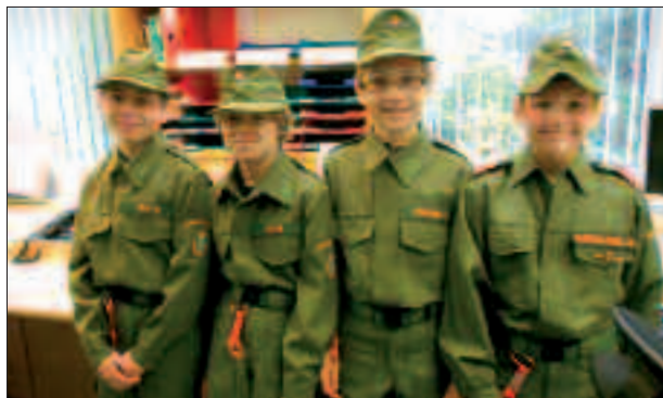
Die Friesacher Jung-Florianis.