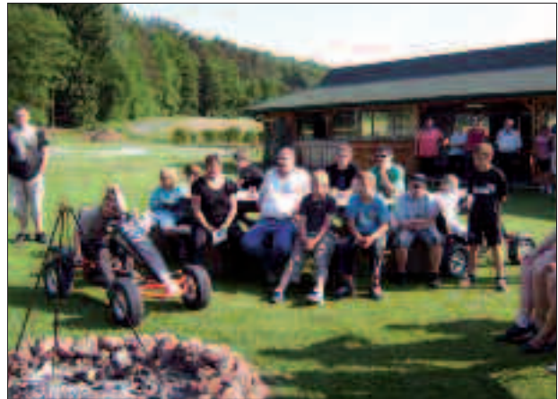
Kindertanzgruppe im Abenteuerland

Für alle Daheimgebliebenen und für die Künstler auf der Bühne gestaltete das Filmteam von K3 wieder einen professionellen Filmbeitrag mit Höhepunkten und Interviews. Dank der fleißigen Oberlanderinnen, die wieder Gebäck und Kuchen spendeten und dank der hilfreichen Hände hinter der Theke, in der Küche und im Service – konnte der Abend auch kulinarisch punkten.