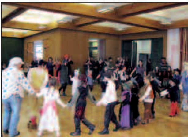
Kinderfaschingsparty im Peggauer Festsaal.

Den krönenden Abschluss stellte heuer aber sicher wieder unsere bekannte Halloweenparty dar, bei der sich fast 90 Kinder bei Gruselpunsch und Geistertunnel so richtig schön gruseln konnten. Auch der Fackelumzug durch Hinterberg war durch die große Anzahl an Kindern ein großartiges Schauspiel.