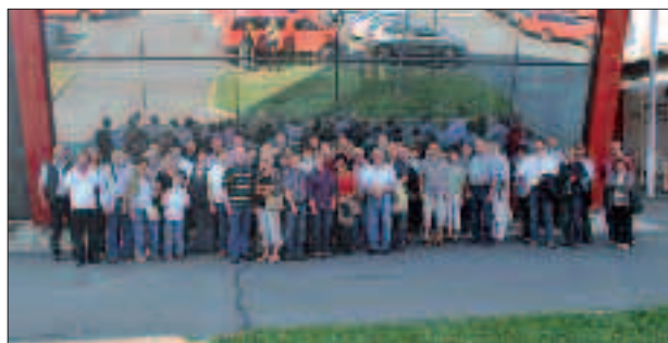
Besichtigung der Feuerwehrschießschule in Lebring.

◆ An der Totengedenkfeier in Deutschfeistritz nahm die Kameradschaft vom Edelweiß mit einer großen Abordnung teil.