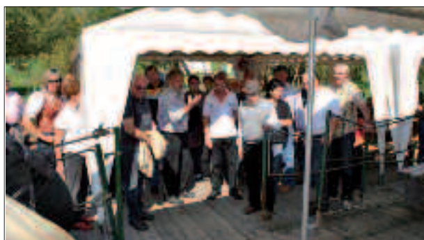
Floßfahrt auf der Drau.