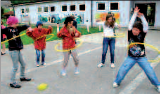
Gelenkig sind sie ... die Peggauer Volksschüler