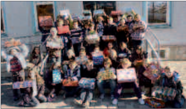
Weihnachten im Schuhkarton