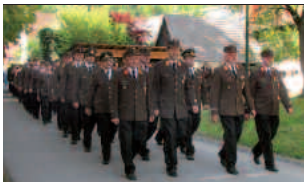
Festlicher Aufmarsch zur regionalen Florianifeier in Friesach.