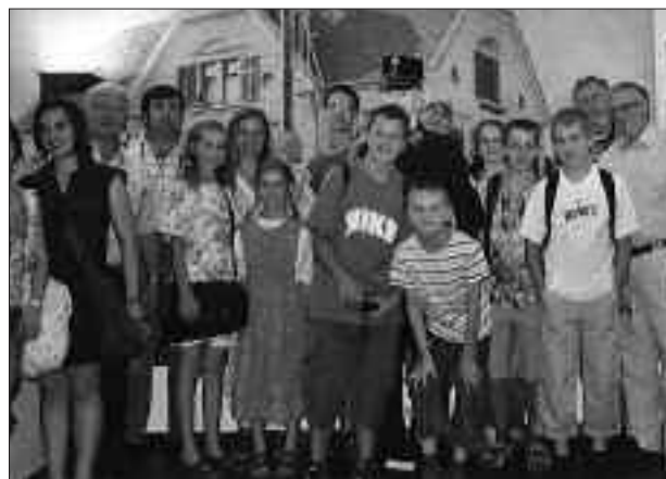
Jugendgruppe des Briefmarkentauschvereins.

◆ Wir besuchten auch viele Ausstellungen wie zum Beispiel im Priesterseminar in Graz, die Veranstaltungen von „Marke und Münze“ in Seiersberg und die Verleihung des „Grazer Merkur“ der Philatelistengesellschaft in Graz und vieles mehr.