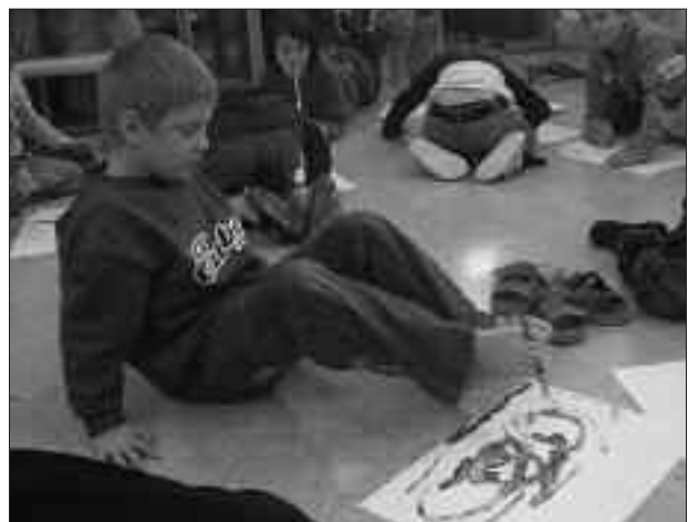
Malen mit Mund und Fuß beweist Kreativität