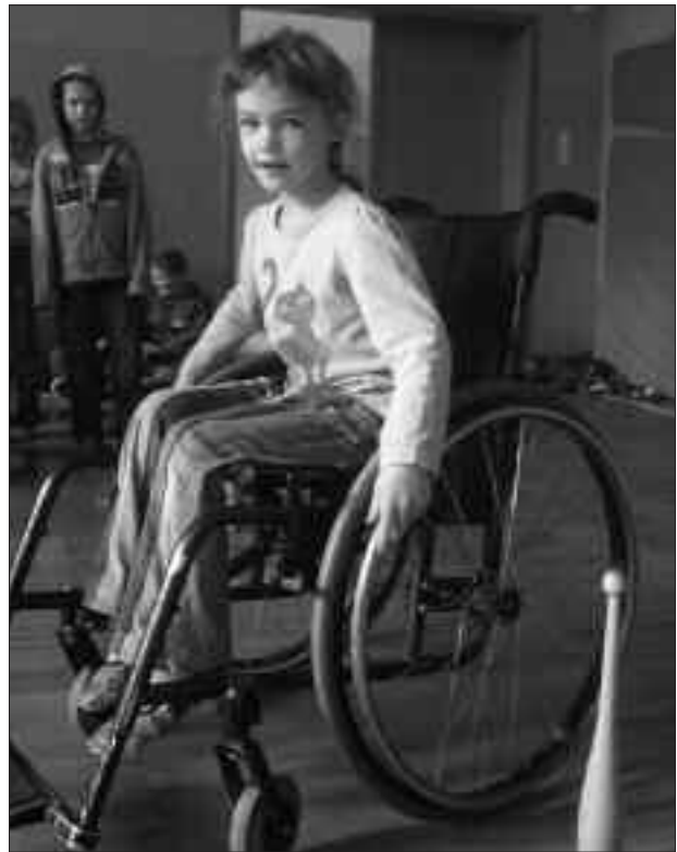
Ein Rollstuhlparcours wurde bewältigt.