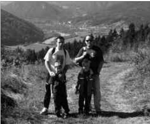
Der Wandertag bot einen schönen Ausblick aufs Murtal.