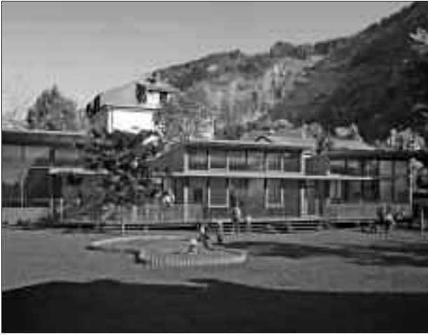
So wird der Kindergarten aussehen.

Nutzung des Turnsaales durch die Kindergartenkinder ein Verbindungstrakt hergestellt und andererseits ein entsprechender Multifunktionsraum errichtet werden, was bei der Kindergartenplanung bereits berücksichtigt wurde. Diese Kosten werden sich auf ca. € 100.000,00 belaufen.