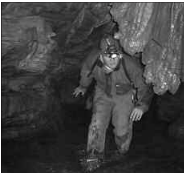
Die Peggauer Lurgrotte hat noch immer ihren Reiz.

Infos über die Lurgrotte Peggau auf unserer Homepage www.lurgrotte.com