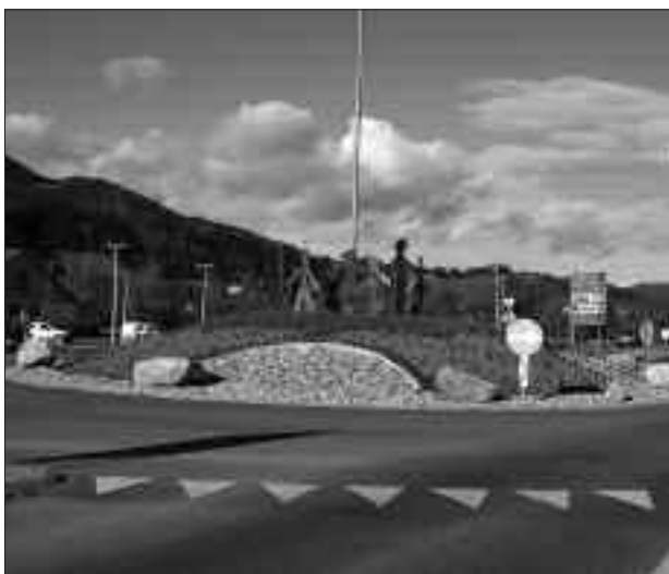
Der neugestaltete Kreisverkehr in Friesach.

Das Kunstwerk soll Gemeinschaft, Zusammenhalt, Freundschaft, Kraft sowie Wärme symbolisieren und an Kultkreise früherer Hochkulturen erinnern.