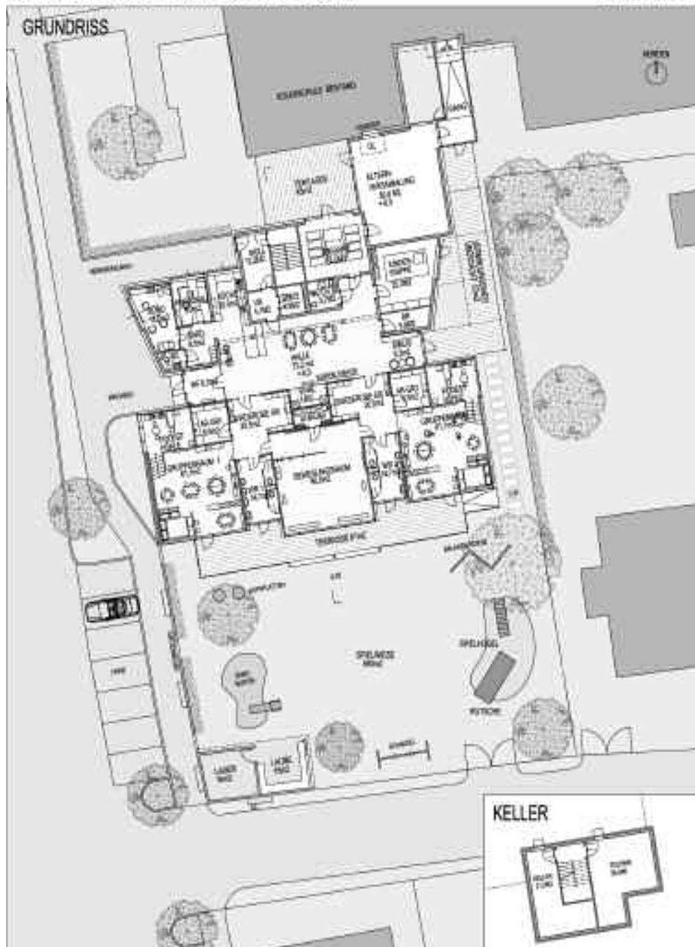
Planungsentwurf für den Kindergarten Peggau.

Raum für diverse Schulveranstaltungen und Elternabende. Es ist ferner erforderlich, das bereits 110 Jahre alte Volksschulgebäude trocken zu legen, da die Kellerräume