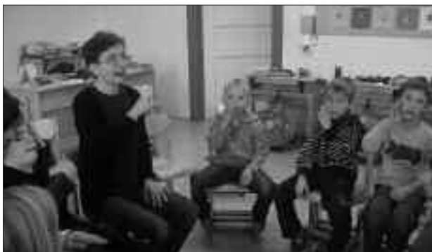
Kommunikation mit Gebärdensprache.

... kann nur, wer bereit ist, sich zu bewegen, sich bewegen zu lassen, eine andere als die gewohnte Position einzunehmen. In der Volksschule Peggau wird „über Mauern geschaut“ – ganz aktuell auch durch die Integration eines schwerstbehinderten Kindes. Da lag es nahe, das vom Verein „Christina lebt“ konzipierte gleichnamige Projekt an der Schule durchzuführen. An drei Tagen hatten die Kinder immer wieder Gelegenheit, die gewohnte Erfahrungsebene zu verlassen und sich in Menschen mit unterschiedlichsten Behinderungen einzufühlen. Berührungängste abbauen, Verständnis wecken, Toleranz schulen – all dies trägt ganz wesentlich zu der ganzheitlichen Bildung bei, die dem Peggauer Lehrerteam am Herzen liegt.