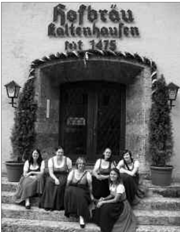
FriesacherFrauenZimmerMusi in Kaltenhausen.