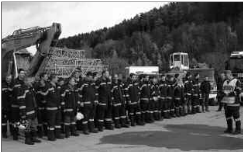
Abschlussübung der Freiwilligen Feuerwehren Friesach-Wörth und Peggau.