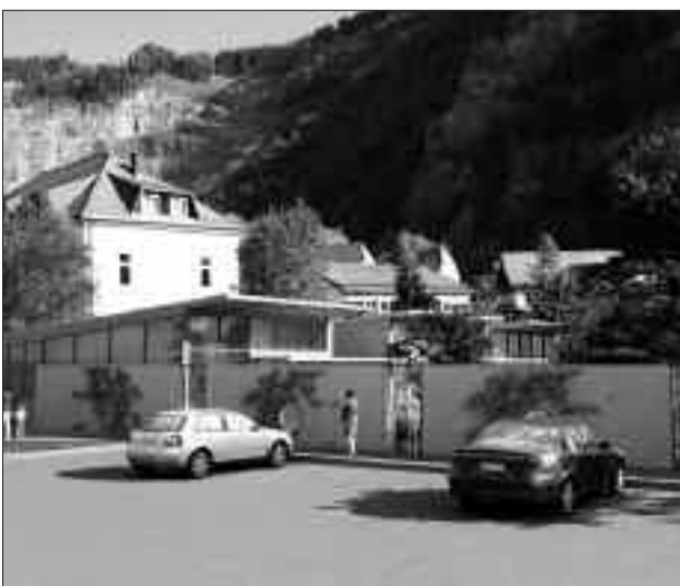
Außenansicht des Kindergartens mit Parkmöglichkeit.

Die diesbezüglichen Kosten werden auf rund € 80.000,00 geschätzt.