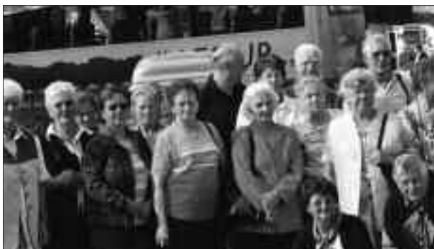
Peggauer Pensionisten auf einer Reise nach Südtirol.

◆ Am 30. März 2007 fand unsere alle drei Jahre fällige Jahreshauptversammlung statt. Nach Berichten des Obmanns, des Kassiers und der Kontrolle wurde der bisherige Ortsgruppenausschuss einstimmig wiederge-