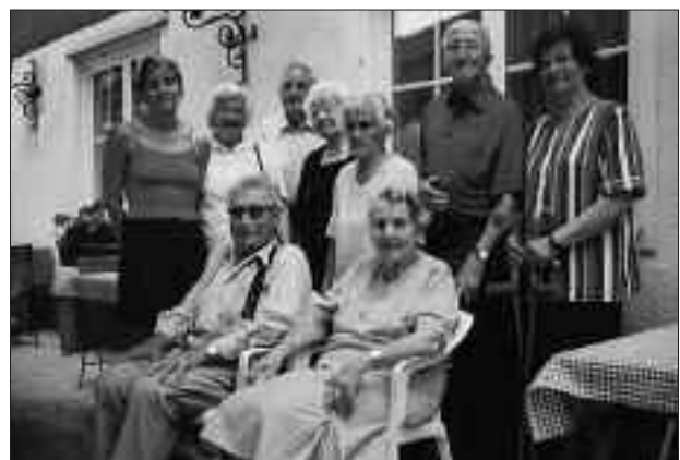
Peggauer Senioren auf Erholungsurlaub in Burgau.

◆ Heuer konnten wir mit 56 Pensionistinnen und Pensionisten hohe Geburtstage feiern und ihnen die herzlichsten Glückwünsche der Gemeindevertretung überbringen.