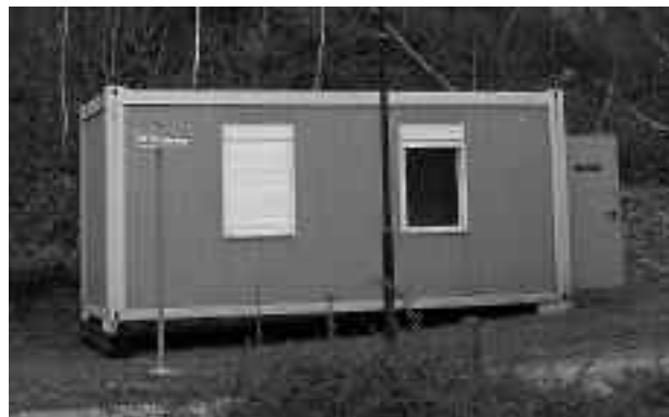
Der Wohncontainer in der Nähe der Pfarrkirche Peggau.