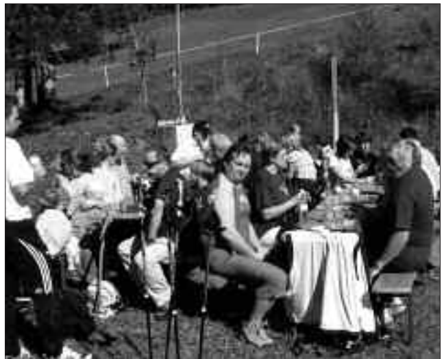
Eine wohlverdiente Rast am Mitteregg.