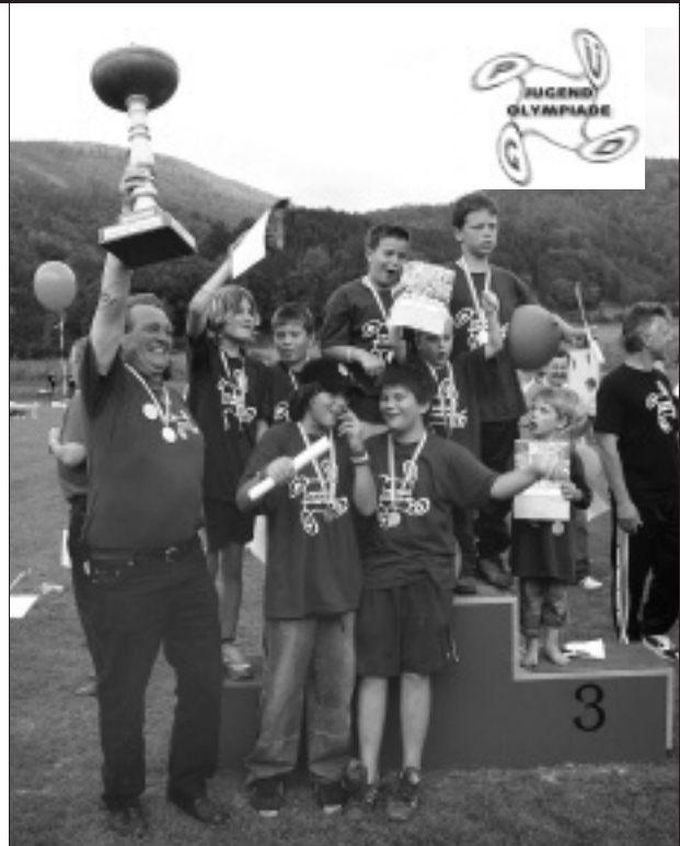
Das Peggauer Team feierte ...

So gab es nicht nur eine Hupfburg und ein Maskenschminken, sondern auch einen lustigen Clown-Auftritt und eine abenteuerliche Dino-Show.