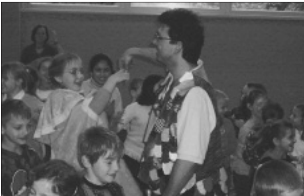
Das Glockenspiel lässt alle Sklaven tanzen.

Schon vor dem Mozartjahr 2006 wurden die Kinder der Volksschule auf höchst unterhaltsame Art auf das Werk des Genies eingestimmt. Zwei Sänger der „Kinderoper Papageno“ aus Wien erarbeiteten mit ihnen in einem vergnüglichen Workshop die „Zauberflöte“, wobei vom Dirigenten bis zur Königin der Nacht, von Sarastro bis Pamina und Tamino fast alle Rollen von den Kindern übernommen wurden. Eine gelungene Vorstellung und wunderbare Einstimmung zu unserem Mozartprojekt, das für den Frühling auf dem Plan steht.