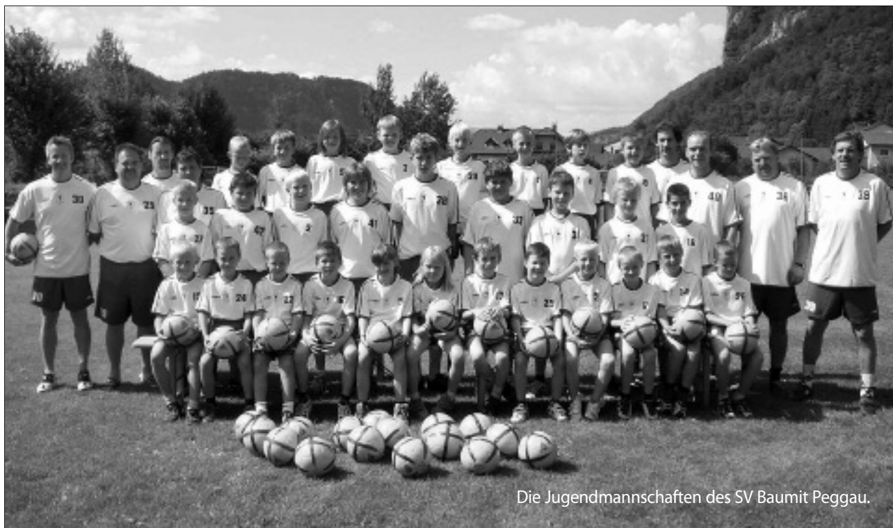
Die Jugendmannschaften des SV Baumit Peggau.

13. – 15. 1. Nachwuchshallenturnier in Deutschfeistritz 18. 2. Sportlerball im Gasthof Salomon 16. – 18. 6. Sportlerfest (mit den Edelseern) und dazwischen wird es eine Einweihung des Zubaus geben.