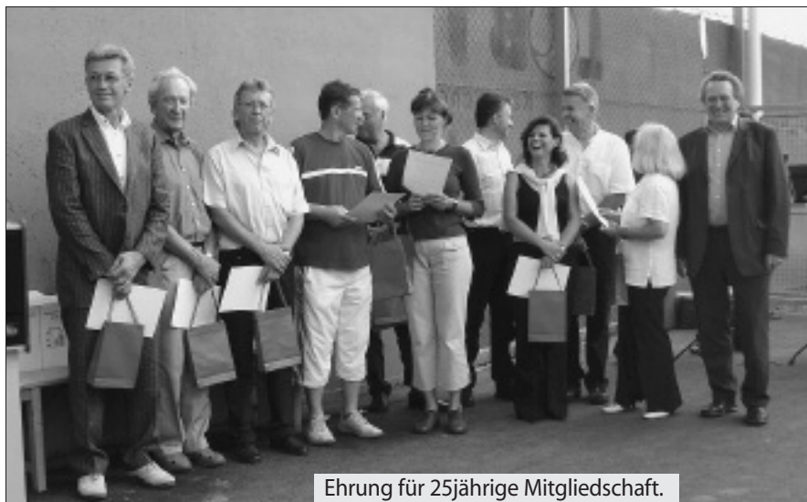
Ehrung für 25jährige Mitgliedschaft.

Es gab aber auch einen gewichtigen Grund zum Feiern. Vor 25 Jahren erfolgte die Gründung des TC Peggau aus