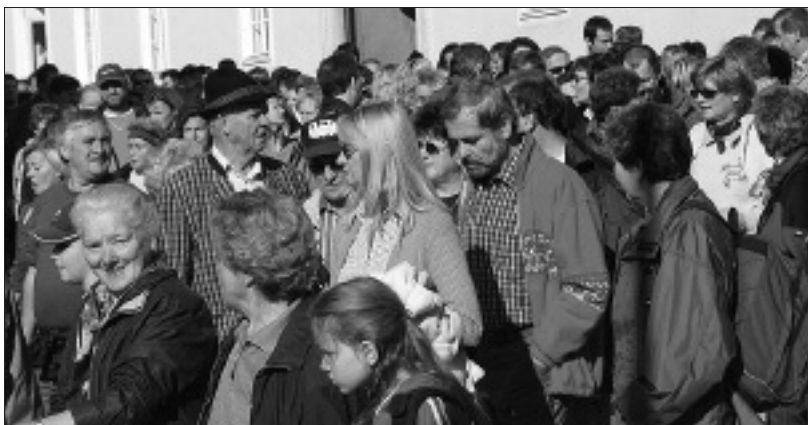
Gedränge vor dem Start beim Übelbacher Gemeindeamt.

Zum bereits fünften Mal fand am 16. Oktober 2005 der mittlerweile schon traditionelle gemeinsame Wandertag der Gemeinden Peggau, Deutschfeistritz, Übelbach und Großstübing statt. Veranstaltergemeinde war dieses Jahr Übelbach, wobei aus allen vier genannten Gemeinden insgesamt zirka 500 Wanderer teilnahmen. Eigentlich hätte dieser Wandertag schon im Sommer stattfinden sollen, aber wie so vieles fiel auch er dem Regenwetter zum Opfer. Umso schöner war aber dafür das Wetter bei diesem Ersatztermin.