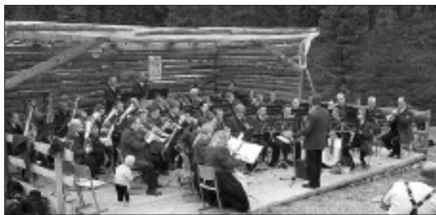
Konzert des Musikvereines beim Südtiroler Almfest in Afers.

Damit standen die Anwesenden während der von Dr. Körner gestalteten Messfeier im direkten Kontakt mit den Musikern. Dies war für alle Beteiligten ein besonderes Erlebnis und wird in den Folgejahren seine Fortsetzung finden.