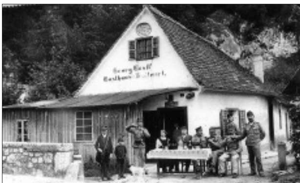
Erinnerungen aus dem Jahre 1910.

Das beliebte Ausflugsgasthaus war auch Ausgangspunkt des bis zur Verwüstung des Badlgrabens durch ein Hochwasser im Jahre 1975 bestehenden Fahr- und Fußweges nach Semriach. Viele können sich vielleicht