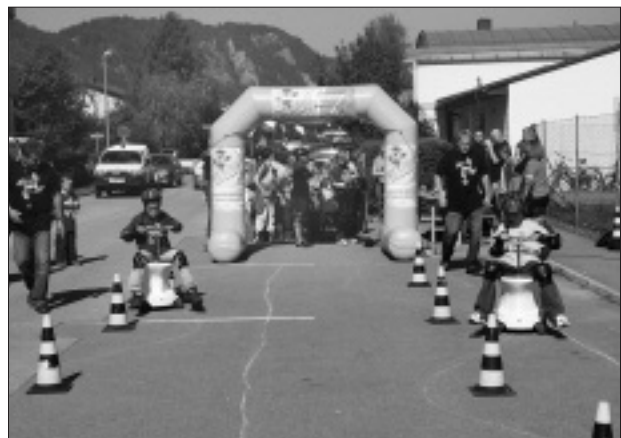
Die Toiletten-Racer waren unterwegs.