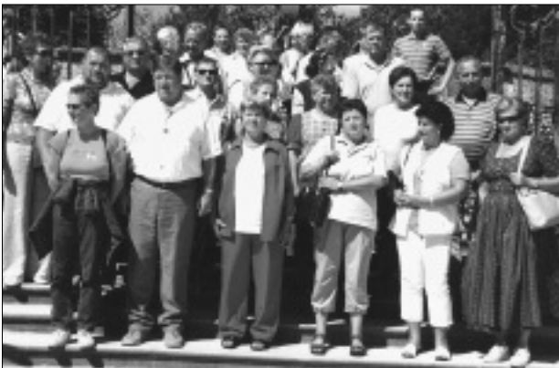
Drei-Tage-Fahrt nach Salzburg und Bayern.

Höhepunkt der Aktivitäten war die 3-Tage-Fahrt (29.–31. August 2005) nach Salzburg . Die Reise ging übers Murtal und den Hohen Tauern zum Königssee. Eine Schiffsfahrt brachte die Urlauber nach Bartolome. Über Berchtesgaden und Bad Reichenhall endete der erste Tag in Eugendorf, wo zweimal übernachtet wurde. Der zweite Tag war der