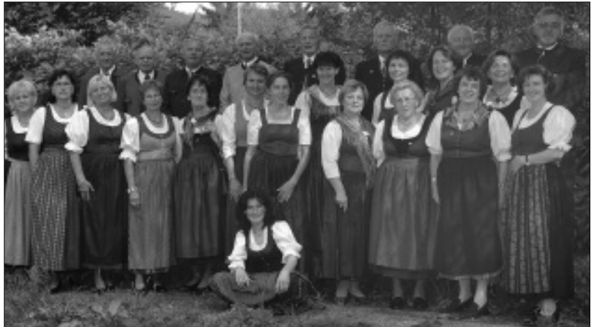
Männergesangverein mit Frauenchor Deutschfeistritz-Peggau.

Auch die Geselligkeit kam nicht zu kurz: Eine Stadtführung in Graz, gemeinsames Wandern und Feiern run-