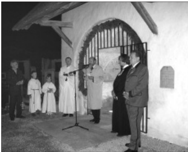
Feierliche Segnung der restaurierten Friedhofskapelle.