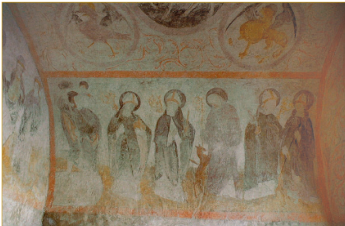
Wandmalerei in der renovierten Friedhofskapelle Peggau.