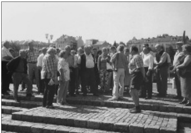
Ausflug des Obst- und Gartenbauvereines.