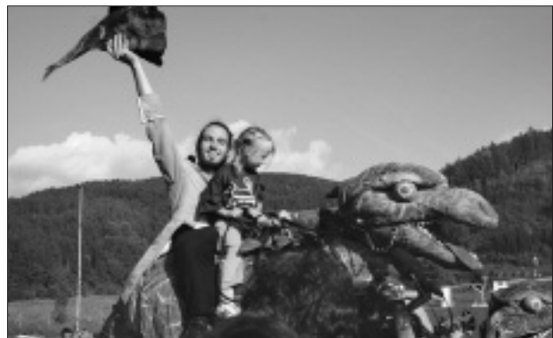
Jede Menge Spass bei der „Jako-Show“.